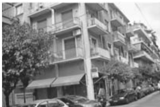
Η εξαόροφη πολυκατοικία στο κέντρο της Αθήνας, οδών Μομφεράτου (παράλληλος της Λεωφόρος Αλεξάνδρας) Πολυζώιδη και Δρόση

3) Γιατί αφαιρέθηκε η πολυδιαφημισμένη ονομασία «Κρίκκειον» ενώ αφορά το ίδιο ίδρυμα; Μήπως έχει σχέση με την επιδίωξη της Μητρόπολης να το εντάξει στα «επιχειρησιακά και περιφερειακά προγράμματα, τα συγχρηματοδοτούμενα από το Πρόγραμμα Δημοσίων Επενδύσεων και Κοινοτικών Πόρων - πράγμα που επέτυχε καθώς και την επιχορήγηση με το ποσό των 750.000 ευρώ»;