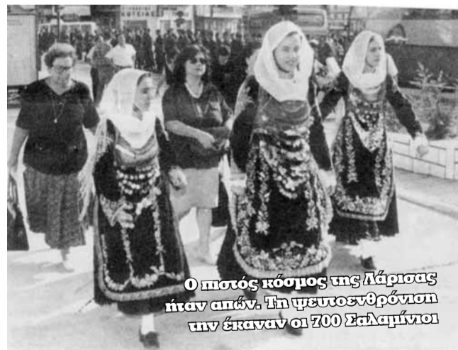
Ο ποσός κόσμος της Λάρισας ήταν απών. Τη ψευτοεθρόνιση αν έκαναν οι 700 Σαλαμίνοι

ασθενοφόρα, οχήματα της Πυροσβεστικής και κλούβες είχαν παραταχθεί έξω από τον περίβολο του Μητροπολιτικού ναού... Ένα τέταρτο μετά τις 6