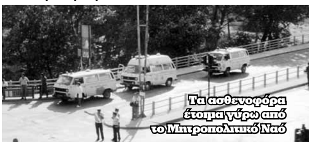
Τα ασθενοφόρα έτοιμα γύρω από το Μητροπολιτικό Ναό

το απόγευμα καταφθάνει στο χώρο ο μητροπολίτης