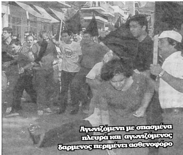
Αγωνιζόμενη με σπασμένα πλευρά και αγωνιζόμενος δαρμενος περιμένει ασθενοφόρο

η θεσσαλική πρωτεύουσα μύριζε... μπαρούτι. Μόνο η πρωτοφανής αστυνομική δύναμη που είχε πλημμυρίσει την πόλη προκαλούσε την περιέργεια των κατοίκων. Από τις 12 το μεσημέρι είχαν αποκλειστεί όλοι οι δρόμοι που βρίσκονταν σε απόσταση 300 μέτρων από το ναό του Αγίου Αχιλλείου. Για να τους διαοχίσει κανείς χρειαζόταν ειδική κάρτα την οποία είχε προμηθευτεί από τον δήμο, ενώ φυσικά δεν επιτρεπόταν η διέλευση σε κανένα αυτοκίνητο. Οχτώ διμοιρίες των ΜΑΤ είχαν οχηματίσει