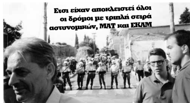
Έτσι είχαν αποκλειστεί όλοι οι δρόμοι με τριπλή σειρά αστυνομικών, ΜΑΤ και ΕΚΑΜ

Εφημ. «Απογευματινή» Της επόμενης ημέρας