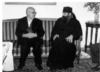
Οι δύο αγωνιστές. Ο πρώτος αφορίστηκε και ο δεύτερος καθαρεύθηκε για την Ορθόδοξη ομολογία

Παρακολουθώντας βήμα-βήμα τις εξελίξεις αυτής της υπόθεσης, διαπιστώσαμε ότι οι καλοστημένες μεθοδεύσεις και σκευωρίες υπήρξαν τόσο πετυχημένες ώστε να χαροποιήσουν τον κ. Ιγνάτιο. Οι συνοδοικοί δικαστές, χωρίς φόβο Θεού και αιχμάλωτοι του καταραμένου «φιλιάδελφου», απέφυγαν να ερευνήσουν αντικειμενικά τις συκοφαντίες, με αποτέλεσμα την εξόντωση του δικαίου π. Ευθυμίου – τον υποβίβασαν στις τάξεις του απλού μοναχού – θυμίζοντάς μας τα λόγια του αρχιερέα