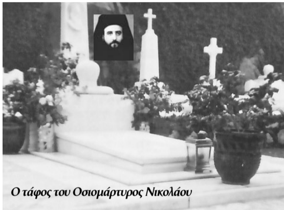
Ο τάφος του Οσιομάρτυρος Νικολάου