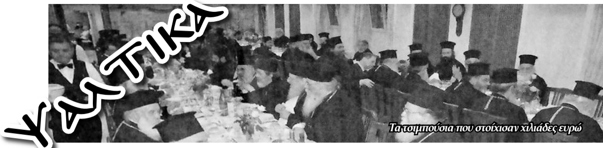
Τα τομπούσια που στοίχισαν χιλιάδες ευρώ