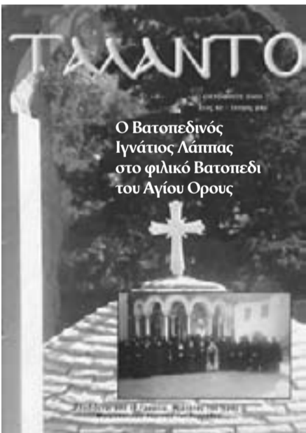
Τα περιοδικά «Το Τάλαντο» γεμάτα από έγχρωμες φωτογραφίες σε διάφορες «πόζες» του δεσπότη Ιγνατίου Λάππια