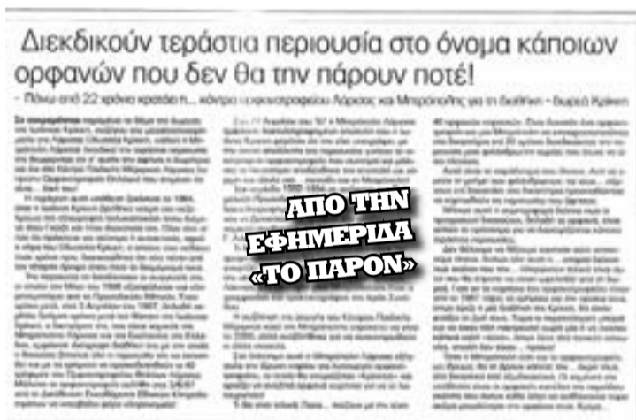
Οτι έγραψε ο τύπος των Αθηνών για το Βατοπέδι της Λάρισας