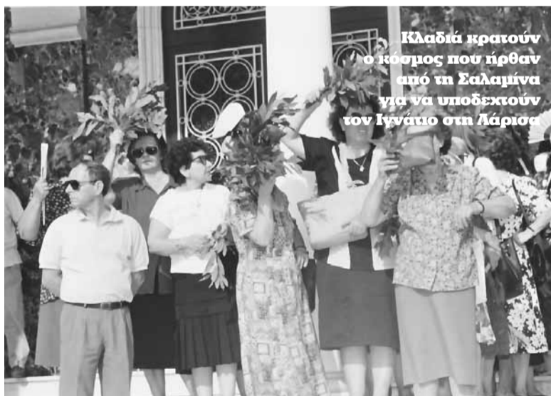
Κλαδιά κρατούν ο κόσμος που ήρθαν από τη Σαλαμίνα για να υποδεχτούν τον Ιγνάτιο στη Λάρισα