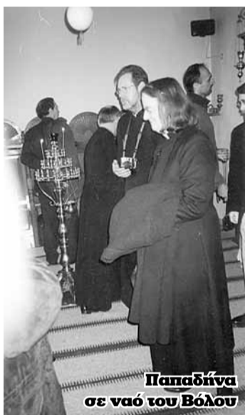
Παπαδήνα σε ναό του Βόλου

Αναμασημένο φαγητό και ήδη καταδικασμένο από τη συνείδηση του πιστού λαού, με ύπουλο τρόπο, έρχεται και πάλι στην επικαιρότητα, μέσω επισήμου εκκλησιαστικού εντύπου, από πανεπιστημιακό δάσκαλο, θιασώτη της παναίρεσης του παπισμού, όπου με παραθεολογίες ολκής, αντι/Κανονικότητες, αντι/Εκκλησιολογικές, αντι/Ορθόδοξες και αντι/Παραδοσιακές « αλχημείες », προσπαθεί να επαναφέρει και πάλι το θέμα της ιερωσύνης των γυναικών στην ΟΡΘΟΔΟΞΗ Εκκλησία του Χριστού, « ήν περιεποιήσατο δια του αίματος του ιδίου » [Πραξ. 20,28]. Μιά απέλπιδα, από χρόνια, άχαρη και καταδικασμένη προσπάθειά του να αλώσει τη Νομο/Κανονική Τάξη της ΟΡΘΟΔΟΞΙΑΣ και ΟΡΘΟΠΡΑΞΙΑΣ, παραπέμποντας σε δικές του μη αποδεκτές εργασίες για την επαναφορά αυτού του ανύπαρκτου πλέον θεσμού, και αναφερόμενος σε απαράδεκτους βερμπαλισμούς, θέσεων και γνωμών, «ταγών» δυστυχώς της Ορθόδοξου Εκκλησίας, με