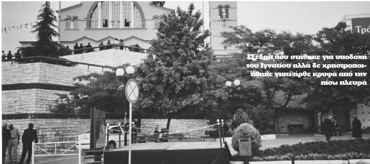
Εξέδρα που στήθηκε για υποδοχή του Ιγνατίου αλλά δε χρησιμοποιήθηκε γιατί ήρθε κρυφά από την πίσω πλευρά

ΣΥΝΕΧΕΙΑ ΑΠΟ ΤΟ ΦΥΛΛΟ ΤΟΥ ΜΗΝΟΣ ΔΕΚΕΜΒΡΙΟΥ