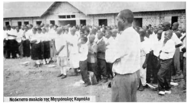
Νεοκτιστο σχολείο της Μητρόπολης Καμπάλα

Αντίθετα – όπως και στο προηγούμενο φύλλο γράψαμε – διάφοροι Σύλλογοι,