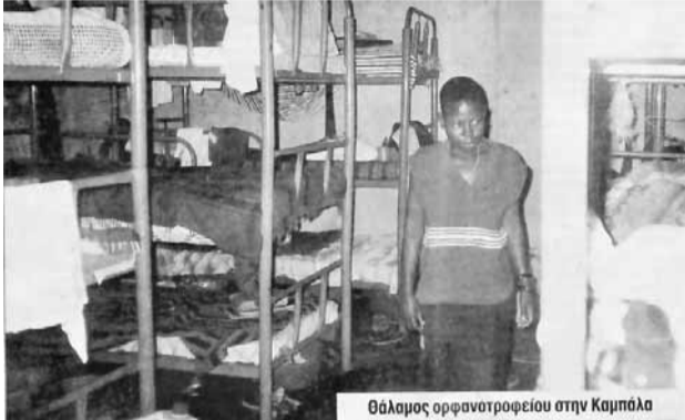
Θάλαμος ορφανοτροφείου στην Καμπάλα

Το 12 ο Πανελλήνιο Συνέδριο των αστυνομικών (ΠΟΑΣΥ), που