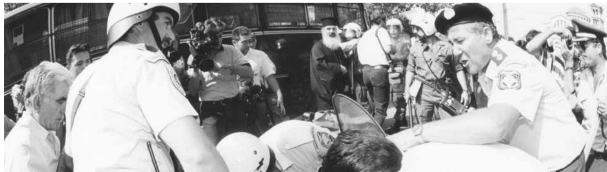
ΑΠΟ ΤΟΠΙΚΗ ΕΦΗΜΕΡΙΔΑ

Ακολούθως ομιλητές που εναλλάσσονταν στράφηκαν κατά του δημάρχου και του νομάρχη: Ο κ. Μπελιάγκας πρέπει να ντρέπεται που δέχθηκε για δεσποτή τον Ιγνάτιο, το διάταγ-