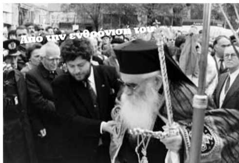
Απο την ενθρόνισή του

Εποίμανε την προσωποπαγή Μητρόπολη Αγίας και Συκουρίου, από το 1991 μέχρι τον Ιανουάριο του 1994 και στις 29 Ιανουαρίου 1994, σε ηλικία 71 ετών εκοιμήθη από καρκίνο. Θα θυμούνται πολλοί πιστοί τότε, ότι ο μακαριστός εδέχθη τη «λύση» της προσωποπαγούς μητροπόλεως, όπως τον «έπεισαν» οι τότε κρατούντες, για την «ειρήνευση» δήθεν της Εκκλησίας. Κι αυτός λόγω της αγαθότητας και της απλότητας, που τον διέκρινε, πίστεψε στα σατανικά σχέδια του τότε αρχιεπισκόπου Σεραφείμ. Που να φανταστεί, ο άνθρωπος του Θεού, ότι όλη αυτή η σκευωρία έγινε για να διασπαστούν οι 6 επιζώντες, εκ των 12, και να λείπει ο Σεραφείμ: «γιατί οι τρεις έκαναν υπακοή